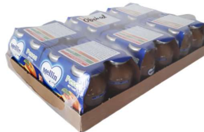
Karton se smršťovací fólií 4x6 125 ml