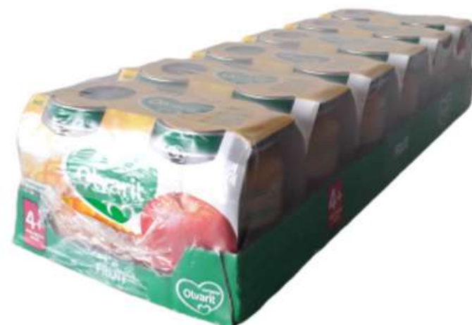
Karton se smršťovací fólií 2x6 125 g nebo 2x6 200 g