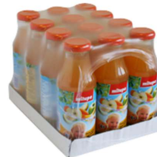
Karton se smršťovací fólií 3x4 175 ml nebo 3x4 300 ml

*pokud máte zájem o jiné formáty, kontaktujte nás