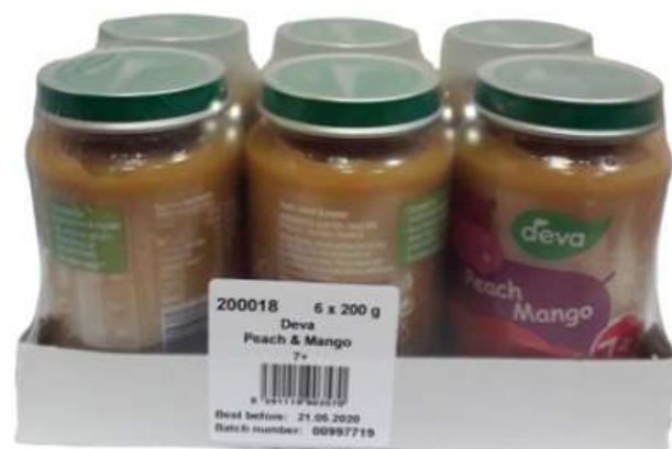
Karton se smršťovací fólií 2x3 125 g nebo 2x3 200 g